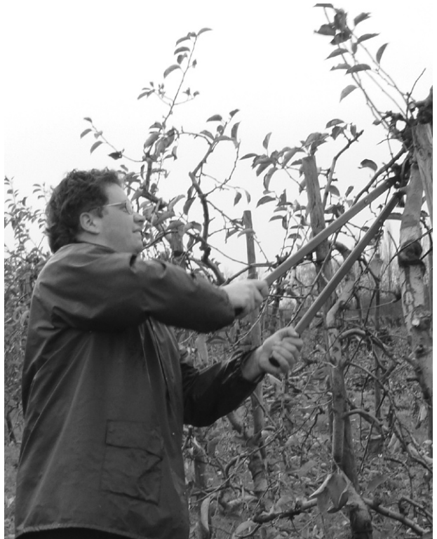
Cliënt is bezig met snoeiwerk op de zorgboerderij

Meer beweging heeft positieve gezondheidseffecten en ook gunstige effecten op bestrijding van overgewicht. Maar wordt er nu daadwerkelijk significant meer bewogen op een zorgboerderij? Om deze vraag te beantwoorden, is dit onderzocht in een praktijkonderzoek. Er zijn diverse metingen en vraaggesprekken verricht bij een drietal cliënten van een zorgboerderij. Uit de metingen blijkt dat ze een aanmerkelijk hogere hartslag en daarmee ook een duidelijk